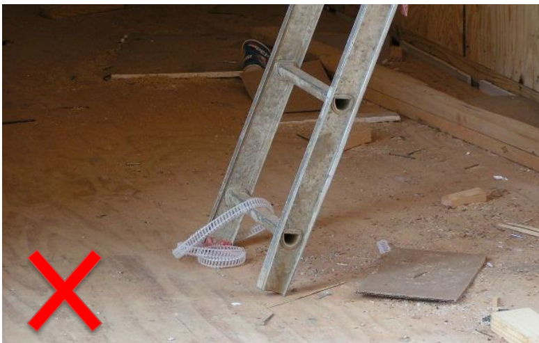
Escalera extensible con montaje de pie y placas faltantes. Esto parece ser la porción superior de una escalera extensible que ha sido separada.