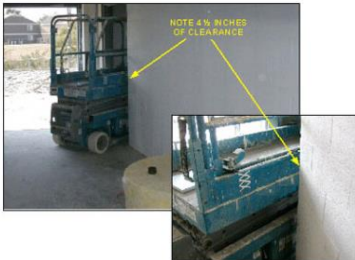
Imagen de la investigación de una fatalidad donde un trabajador de medio tiempo de 42 años murió cuando el elevador de tijera que estaba operando se elevó y lo sujetó contra la cabecera de una puerta interior. REPORTE FACE Interno NIOSH 2003-01 (*6)

OSHA Estándar 1926.452(w)(6) Los empleados no deben ser permitidos a montar en el andamio a menos que... la superficie en la que el andamio vaya a ser movido esté dentro de 3 grados de nivel y libre de agujeros, hoyos y obstrucciones.