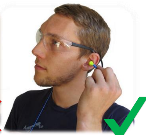
Tapones de oído adecuados (*6)