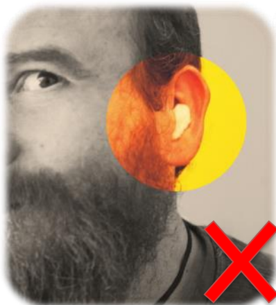
¡Poner algodón en el oído como protección auditiva puede ser muy peligroso! (*5)

OSHA Estándar 1926.52(b) Cuando los empleados están sujetos a niveles de sonido que exceden aquellos en la Tabla D-2 de esta sección, se deben utilizar controles administrativos o de ingeniería factibles. Si dichos controles fallan en reducir los niveles de sonido dentro de los niveles de la tabla, equipo de protección personal como es requerido en la Subsección E, debe ser proporcionada y utilizada para reducir los niveles de sonido dentro de los niveles de la tabla.