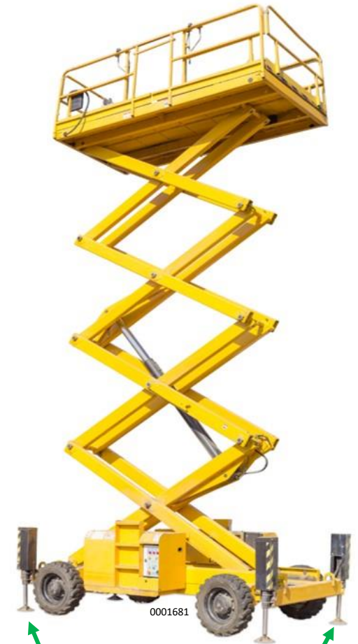
Soportes usados para estabilizar y nivelar el elevador de tijera.

OSHA Estándar 1910.28(b)(12)(i) El empleador debe asegurar que cada empleado en un andamio esté protegido de las caídas.