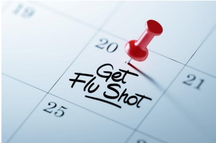
Obtenga la Vacuna contra la Gripe

De acuerdo a la CDC, la prevención es mejor que la cura cuando se trata de cualquier enfermedad, incluyendo la gripe. Cada año, en promedio, 5% - 20% de la población tiene la gripe y esto cuesta billones de dólares anualmente.