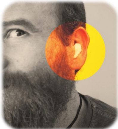
¡Poner algodón en el oído como protección auditiva puede ser muy peligroso! (*5)

OSHA Estándar 1910.95(c)(1) El empleador debe administrar un programa continuo y efectivo de conservación de la audición... siempre que las exposiciones de ruido del empleado sean iguales o excedan el promedio ponderado de 8 horas de nivel de sonido (TWA) de 85 decibeles... sin tomar en cuenta... el uso de equipo de protección personal.