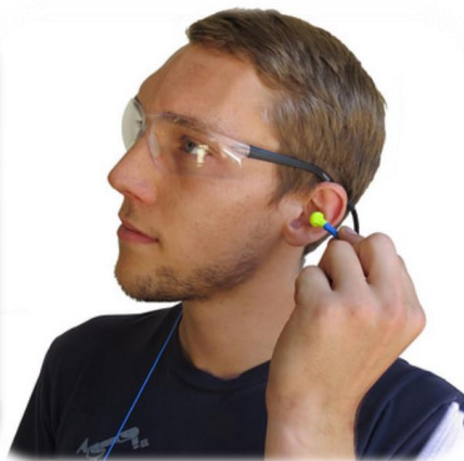
Tapones de oído adecuados (*6)