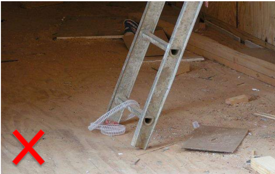
Escalera extensible con montaje de pie y placas faltantes. Esto parece ser la porción superior de una escalera extensible que ha sido separada.