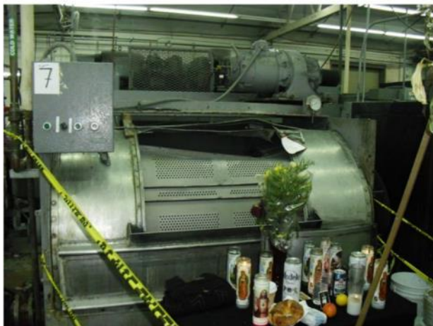
Prueba 2. La lavadora industrial involucrada en el incidente.

Un trabajador de 28 años fue aplastado y matado por una lavadora industrial de tambor horizontal. La máquina fue accidentalmente encendida por otro trabajador mientras él se extendía a la máquina para sacar ropa. La causa de muerte según el certificado de defunción fue asfixia traumática y trauma contundente al torso.