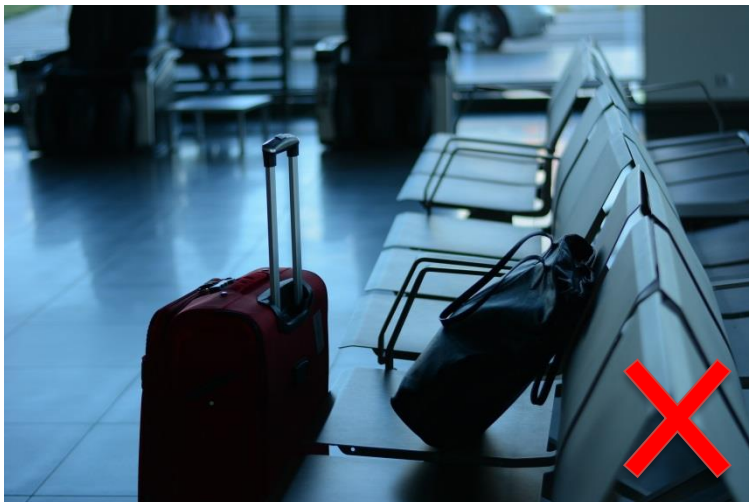
(*8) Nunca dejes bolsas desatendidas al viajar.