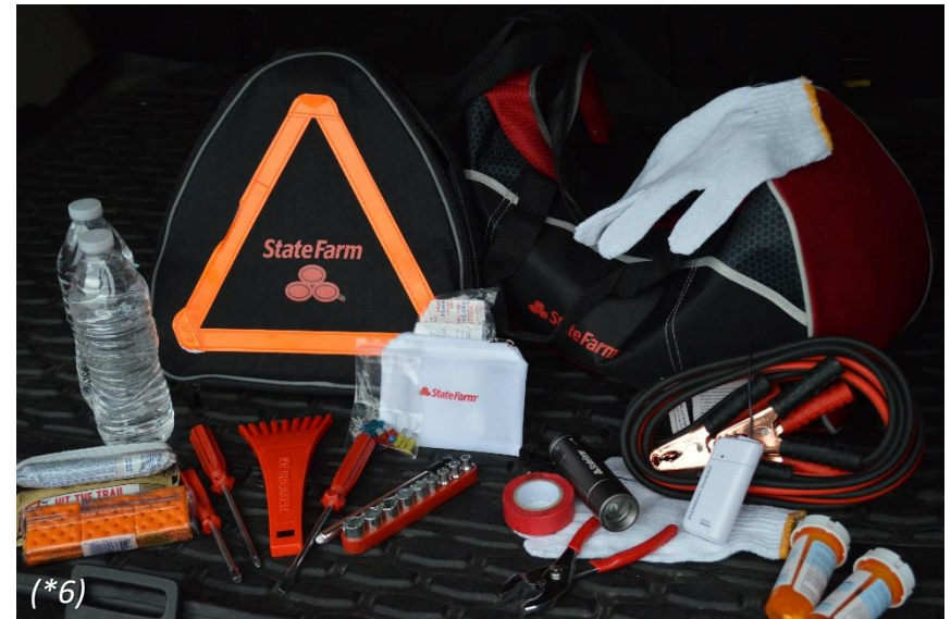
Ejemplo de kit de emergencia preparado que puede ser mantenido en la cajuela.

Si te quedas varado en una tormenta invernal, no entres en pánico y mantente con tu carro a menos que el sitio de seguridad o la ayuda esté a menos de 100 yardas de distancia. Sigue estos consejos para que llegue la ayuda.